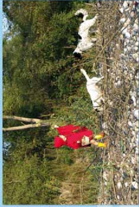
Immagine tratta dalla Mostra "Gioco con poco" di Enrico De Santis - www.edsarf.it

Alcune attività sono realizzate grazie al co-finanziamento dell'Assessorato ai Progetti Culturali e Politiche per i Giovani e di Arciragazzi Liguria (progetto Città Giu'Ocosa e promozione dei Diritti co-finanziato dalla Regione Liguria).