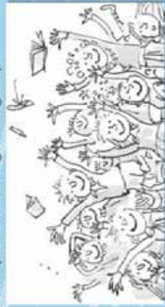
Illustrazione di Quentin Blake

A cura di Arciragazzi Genova, in collaborazione con il Celivo (progetto "il mese dei Diritti"), con il contributo dell'Assessorato ai Progetti Culturali e Politiche per i Giovani e di Arciragazzi Liguria, nell'ambito del progetto Città GiuOcosa e promozione dei Diritti (co-finanziamento da parte della Regione Liguria).